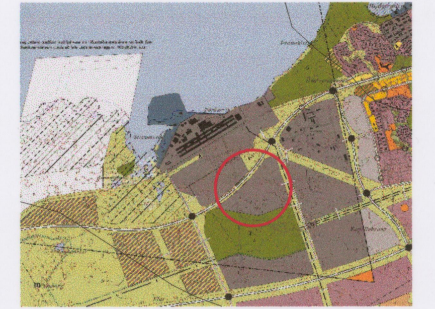
ADALSKIPULAG HAFNARFJARÐAR 2005 - 2025